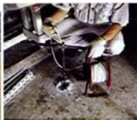
地盤災害に耐えた家は何か違ったのか →35ページ