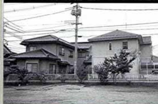
2007年新潟県中越沖地震