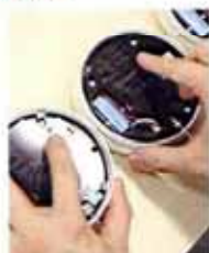
連動させるために1台ずつ設定 →51ページ