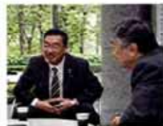
福島で復旧に取り組む工務店社長 →15ページ