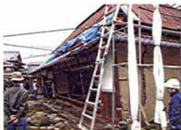
伝統構法の引き出し実験 →26ページ