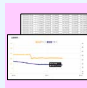
専用WEBサイト WLM水位計 データサイト

TEL 03-6273-0892 MAIL info@asahigs.co.jp